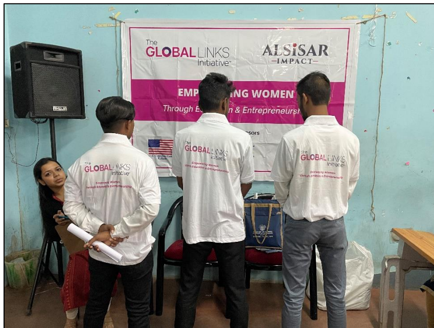
Students wearing TGLI logo embedded T-Shirt