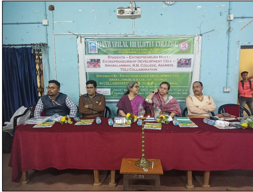
The Global Links Initiative (TGLI) team visited college